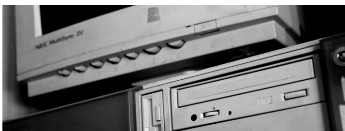
Neterškite aplinkos elektroninėmis atliekomis! Pristatykite jas surinkėjams ar meskite į tam skirtus konteinerius ir jums tarnavęs prietaisais atgims nauju gaminiu.

Netinkamai laikoma ir atliekų perdirbėjams neatiduota sena elektros ir elektroninė įranga (EEI) sunkiaisiais metalais ir kitomis pavojingomis medžiagomis gali užteršti gruntinius vandenis, dirvą, orą. Nuolatinė aplinkos tarša kenkia žmogaus sveikatai.