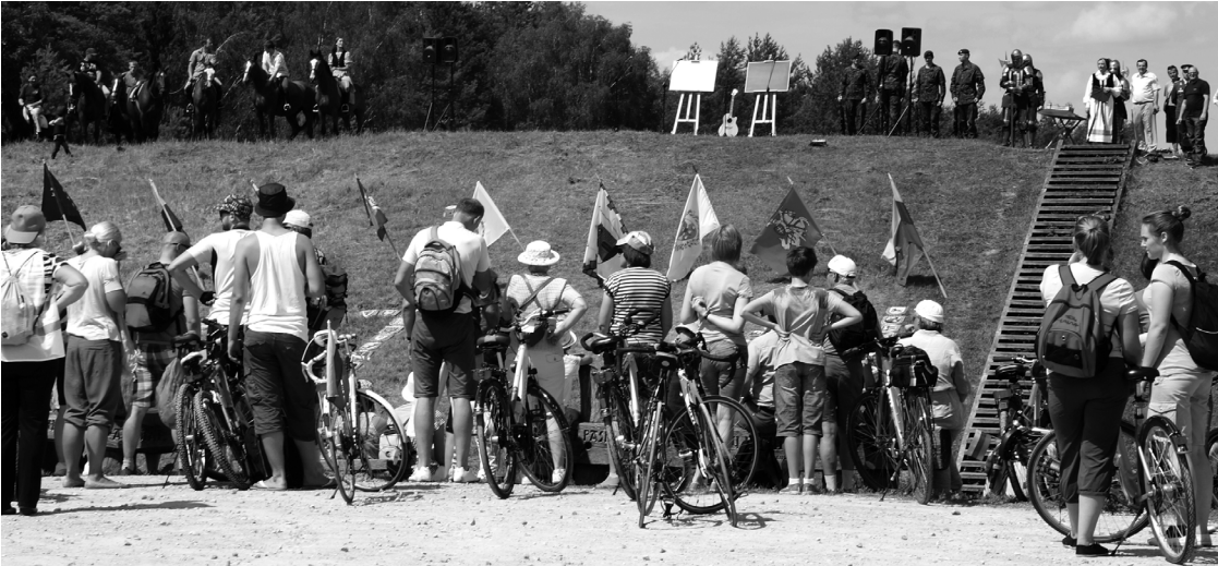
Prie Šeimyniškių piliakalnio dviratininkus pasitiko raiteliai su žirgais, karininkai ir kovos kostiumais pasidabinę viduramžių kariai.

Paminėti liepos 6-ąją, Lietuvos karaliaus Mindaugo karūnavimo ir valstybės dieną, geras šimtas įvairaus amžiaus dviratininkų keliavo karaliaus Mindaugo keliu nuo Šeimyniškių iki Palatavio piliakalnio. Vakare prie Anykščių Kultūros centro koncertavusi grupė „Thundertale“ drauge su anykštėnais 21 valandą giedojo Tautišką giesmę.