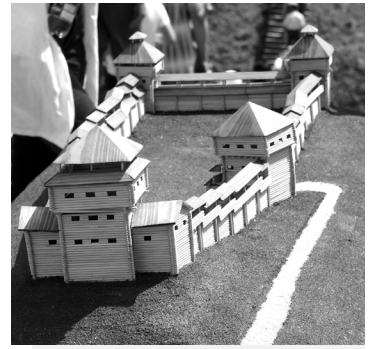
XIII amžiaus medinės pilies maketas buvo eksponuojamas ant Šeimyniškių piliakalnio.

Scenoje dar prieš giedojimą (pusę devynių vakaro) vyko grupės „Thundertale“ (liet. Perkūno saktmė) koncertas. Kelios minutės prieš 21 valandą, grupės nariai priminė, jog šiandien tradiciškai visame pasaulyje, kiekvienoje šalyje, kurioje gyvena lietuviai, tuo pačiu metu - 21 valandą - bus giedama Tautiška giesmė. Pasaulį Tautiška giesmė apkelia per 24 valandas. Laikrodžiui,