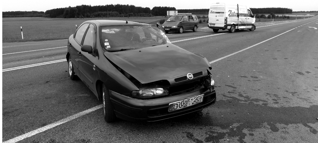
„Fiat“-u, kuris Svėdasų sankryžoje pateko į avariją, į vestuves net iš Pagėgių važiavo trys žmonės.

Šventinį savaitgalį Anykščių rajone įvyko kelios autoavarijos. Vienoje iš jų žuvo policijos pareigūnas.