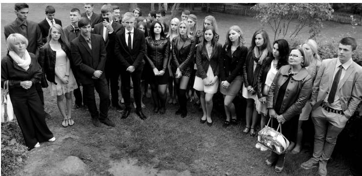
Pirmą kartą Anykščių abiturientai atestatus gaus visi kartu.

Šį penktadienį, liepos 11 dieną, Anykščių Jono Biliūno gimnazija išleis pirmąją laidą po 2012-2013 m. įvykdytos rajono savivaldybės bendrojo ugdymo mokyklų tinklo pertvarkos. Šiomet gimnaziją baigia 151 abiturientas. Tiek oficialioji, tiek vakarinė išleistuvių šventės dalis vyks verslo ir laisvalaikio centre „Nykščio namai“.